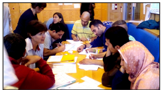
Deutschkurs in einer Flüchtlingsunterkunft

6. Schulstufe, Modul 9: Gesetze, Regeln, Werte 7. Schulstufe, Modul 4: Internationale Ordnungen und Konflikte im Wandel