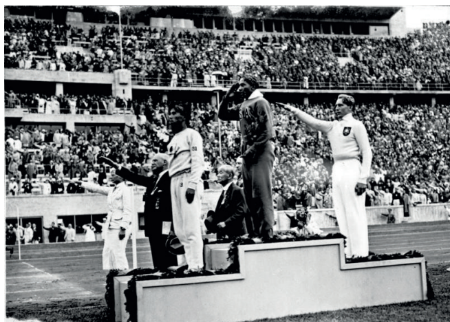
Der US-amerikanische Leichtathlet Jesse Owens ganz oben auf dem Siegespodest nach seinem Sieg im Weitsprung 1936 in Berlin.

Die ersten Spiele, die als professionelles, durchinszeniertes Massenereignis im heutigen Sinn begangen wurden, waren jene von 1932 in Los Angeles. Sie waren Vorbild für die Nationalsozialisten, die die Olympischen Spiele 1936 in Berlin zu Propagandazwecken missbrauchten. Zunächst standen die Nationalsozialisten den olympischen Idealen skeptisch gegenüber. Sie änderten jedoch ihre Meinung, als das Reichspropagandaministerium unter Joseph Goebbels begann, die Spiele als geeignetes Mittel zur Umsetzung der politischen Zwecke der Nationalsozialisten zu sehen. Ziel war es zu diesem Zeitpunkt in erster Linie, die Welt von der Friedfertigkeit Deutschlands als solidem Mitglied der internationalen Gemeinschaft zu überzeugen. Nach innen sollten die Spiele ein Gefühl der Einheit erzeugen und von innenpolitischen Missständen ablenken: Oppositionelle Sportverbände wurden verboten, viele ihrer Sportler und Sportlerinnen sowie Funktionäre und Funktionärinnen umgebracht. Die Gleichschaltung der Presse wurde intensiviert, zur Besänftigung ausländischer Kritik wurden ein jüdischer Sportler und eine jüdische Sportlerin zugelassen. 10