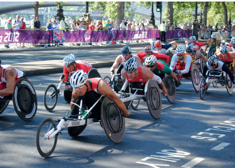
Paralympics Marathon bei den Paralympischen Spielen 2012 in Boston.

Neben der Begeisterung der AthletInnen und ZuschauerInnen gibt es auch Kritik und Forderungen nach mehr Inklusion im Sport: