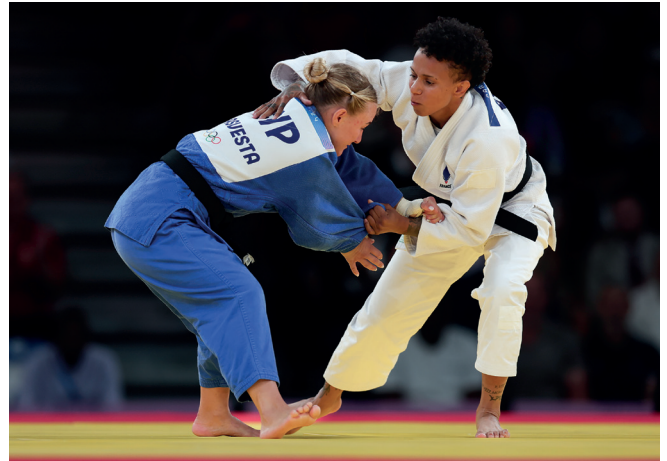
Judo Achtelfinale der Frauen in der Kategorie 52 kg, Olympische Spiele 2024 in Paris. Foto: France Olympique (CC BY-NC-ND 2.0).

Herd“ zurückverwiesen. Auch wenn Frauen bereits bei den Olympischen Spielen im Jahr 1900 zu einzelnen Wettkämpfen antreten durften, blieben viele olympische Disziplinen lange den Männern vorbehalten. Auch die Aufteilung in „typische Männersportarten“, die mit Körperkraft und Kampf verbunden wurden, und „anmutige, weibliche Sportarten“ hielt sich hartnäckig. 6