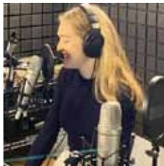
Moderation: Ambra Schuster

Richtig & Falsch – Podcast für Politische Bildung: politik-lernen.at/richtigundfalsch