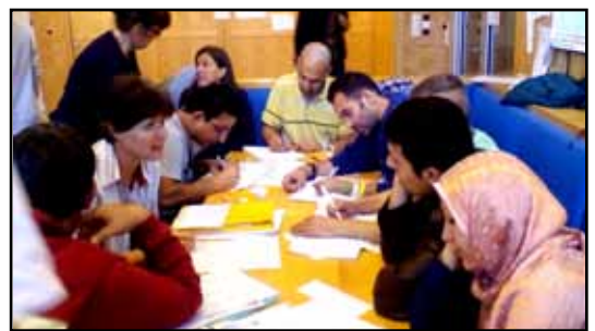
Deutschkurs in einer Flüchtlingsunterkunft

6. Schulstufe, Modul 9: Gesetze, Regeln, Werte 7. Schulstufe, Modul 4: Internationale Ordnungen und Konflikte im Wandel