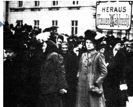
Demonstration für das allgemeine Frauenwahlrecht am 19. März 1911 am ersten Frauentag in Wien.