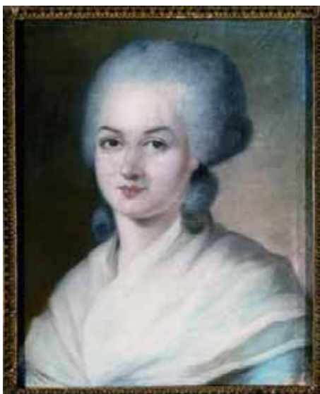
Olympe de Gouges (1748–1793), Autorin der Erklärung der Rechte der Frau und Bürgerin aus dem Jahr 1791

1848: In Seneca Falls im Staat New York wird durch Elizabeth Cady Stanton und Lucretia Mott eine Tagung einberufen, bei der das Thema Diskriminierung von Frauen auf der Tagesordnung steht. Die Declaration of Sentiments , die eng an die Unabhängigkeitserklärung von 1776 angelehnt ist, wird verabschiedet. Diese Grundsatzerklärung richtet sich gegen die Dominanz der Männer in allen Lebensbereichen. Dem Text liegt die Prämisse zugrunde, dass alle Männer und Frauen mit den gleichen Rechten auf Leben, Freiheit und dem Streben nach Glück geboren werden und dass die Sicherung dieser unveräußerlichen Rechte einzig legitimer Staatszweck sei.