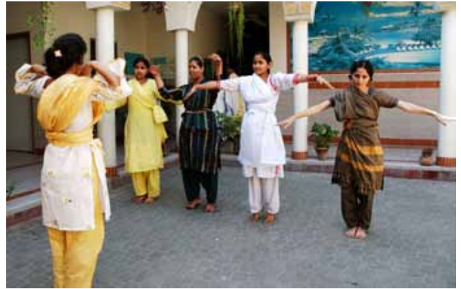
Im Haus Panah in Pakistan können sich Opfer von Gewalt in der Familie von ihren Verletzungen erholen und sind vor Verfolgung durch die Täter sicher.