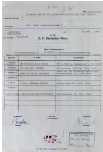
Gründungsdokument des Vereines Soziale Hilfen für gefährdete Frauen und Kinder (1978), der das erste Wiener Frauenhaus schuf, in der Ausstellung „Am Anfang war ich sehr verliebt ...“

Die zweite Frauenbewegung hat viel erreicht: Sie hatte in allen gesellschaftlichen Bereichen einen kaum zu überschätzenden Einfluss – sowohl auf der institutionellen wie auch auf privater Ebene, z.B. im Zusammenleben der Geschlechter. Viele Forderungen wurden umgesetzt (Ungleichbehandlungen von Ehefrauen im Familien- und Eherecht, Scheidungsrecht und Sorgerecht wurden beseitigt), in vielen Ländern wurde die Fristenlösung eingeführt, Quoten zur Frauenförderung existieren etc.