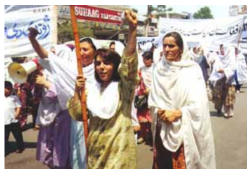
Afghanische Frauen gehen in Pakistan für ihre Rechte auf die Straße.

Eine wichtige Aufgabe der Frauenbewegungen heute ist die Verankerung der Frauenrechte als Bestandteil der universell gültigen Menschenrechte im Völkerrecht. Die Frauenrechte müssen über religiösen und kulturellen Traditionen der einzelnen Länder stehen. Es braucht internationale Sanktionsmöglichkeiten gegen Staaten, welche die Frauenrechte nicht achten.