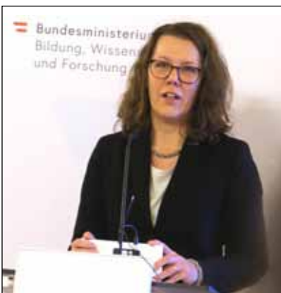
Bundesministerin Iris Rauskala hält die Festrede.

„(...) Die vielen eingereichten Arbeiten verweisen auf ein hohes gesellschaftspolitisches Bewusstsein, eine hohe Sensibilität für gesellschaftspolitische Fragen bei den jungen Menschen und sie zeigen, wie wichtig ihnen eine fundierte Auseinandersetzung mit diesen Fragen ist.“