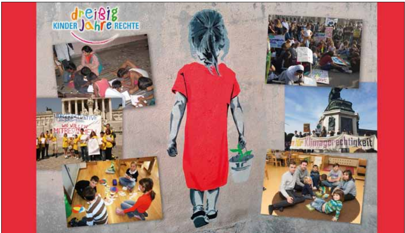
Coverausschnitt des polis aktuell „Kinderrechte“