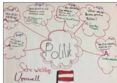
Plakat aus einem Volksschulworkshop zum Thema „Was machen eigentlich PolitikerInnen?“ am 6. Mai in Linz