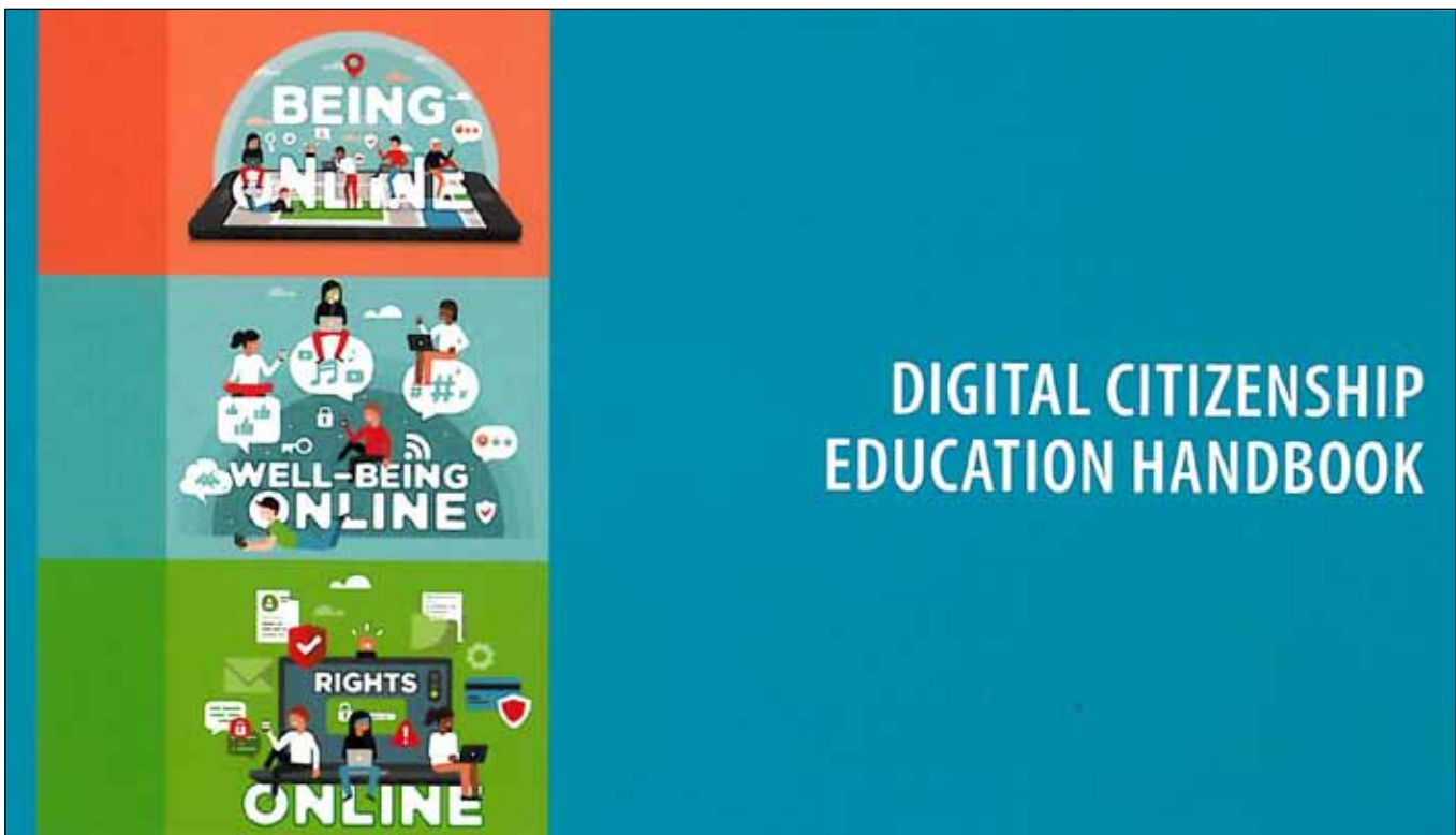
Das Digital Citizenship Education Handbook des Europarats