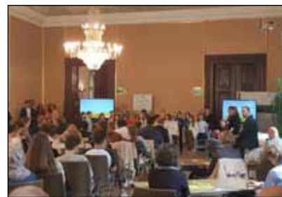
Auftaktveranstaltung im Landtag Steiermark: „Europa – Zukunft braucht Erinnerung“.