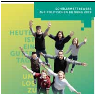
Wettbewerbsthemen 2019: Recht auf Bildung, Kinderrechte, Grenzen, Frauen in der Politik, Künstliche Intelligenz, Kunststoffverpackungen, Heimat, Politik brand-aktuell u.a.

Außerdem wurde im Dossier Wahlen ein Eintrag mit Link- und Materialtipps speziell zur #NRW19 angelegt.