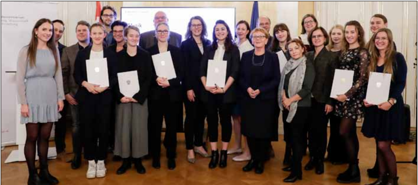
Bundesministerin Iris Rauskala mit den Preisträgerinnen und ihren Betreuungslehrkräften