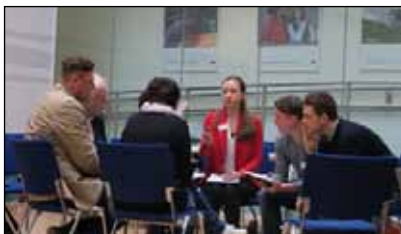
Gruppenarbeit beim EPAS-Vertiefungsseminar am 25. Februar 2019 im Haus der EU in Wien.