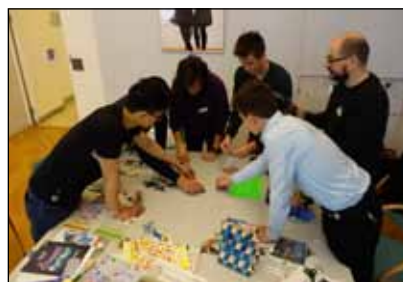
Workshop in der Bildungsdirektion Wien: Erstellung von Stop-Motion-Filmen zum Thema Schuldemanokratie