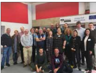
Die TeilnehmerInnen des Train-the-Trainer-Seminars im April 2019 in Strasbourg

Das „Digital Citizenship Education Project“ des Europarats wurde 2016 ins Leben gerufen und will junge Menschen zur informierten Teilhabe an der digitalen Gesellschaft befähigen. Ein erstes umfassendes Produkt des Programms ist das „Digital Citizenship Education Handbook“ aus 2019. Das Handbuch ist eigentlich ein Schuber, der aus 25 Broschüren und Faltblättern in einem Umfang von jeweils zwischen vier und 20 Seiten besteht. Dargestellt werden die zehn wichtigsten Dimensionen