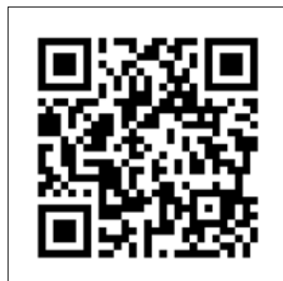
Der QR-Code der Station zum Thema Asyl