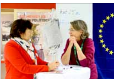
Bild 1