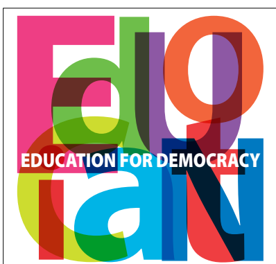
Logo der Bildungsabteilung des Europarats

Beim Kick-off am 4./5. Februar 2019 in Wien nahmen VertreterInnen aller Projekte teil: De Nieuwe Internationale School Esprit, Amsterdam; Die Demokrative, Zürich; Evangelische Trägergruppe für gesellschaftspolitische Jugendbildung, Berlin; International Institute of Humanitarian Law, Sanremo, Italien; MBO Raad (Berufliche Bildung), Niederlande; Schwarzkopf-Stiftung Junges Europa, Berlin. Die Belarusian Republican Pioneer Organization konnte auf Grund von Visa-Problemen nicht teilnehmen.