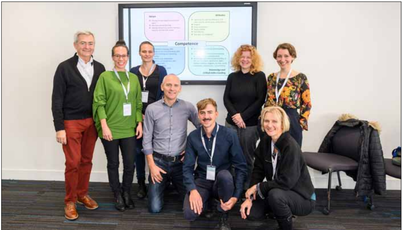
Die NECE-Fokusgruppe Demokratiekompetenzen bei der NECE-Konferenz in Glasgow.