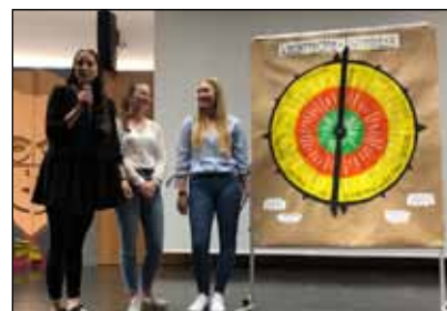
BAFEP-Schülerinnen bei der Präsentation ihres Kinderrechte-Kompasses an der PH Kärnten.