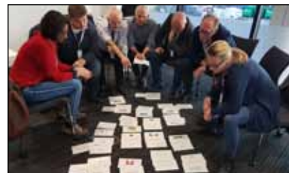
Abbildung 1: Kick-off-Treffen der NECE-Fokusgruppe im Februar 2019 in Wien