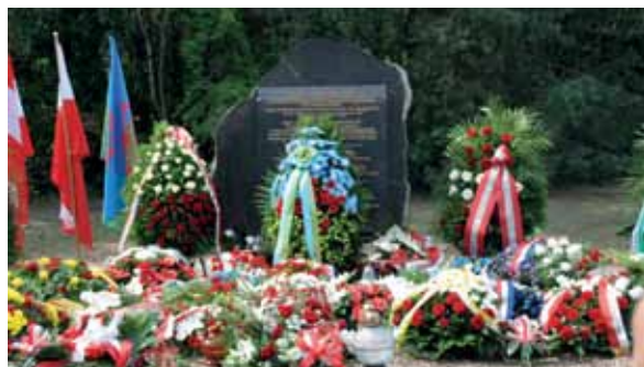
Inschrift des Gedenksteins: „Gewidmet allen, die als ganze Familien in den Himmel gezogen sind ... Zum Gedenken an etwa 4.300 Roma und Sinti aus Österreich, die im Jänner 1942 aus dem Ghetto Litzmannstadt in das Vernichtungslager Kulmhof verschleppt und dann im selben Monat von den deutschen Besatzern ermordet wurden. Ihre Schreie und Leiden nahm der Erdboden auf, der die Asche tausender Opfer verbirgt. Wir werden Euch nie vergessen!“