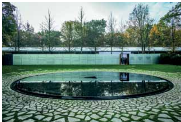
Denkmal für die im Nationalsozialismus ermordeten Sinti und Roma Europas neben dem Reichstag in Berlin, eingeweiht im Oktober 2012.

Eine Resolution des Europaparlaments erklärte den 2. August zum offiziellen europäischen Gedenktag an den Roma Holocaust. Seit 2023 ist der 2. August auch in Österreich ein nationaler Gedenktag.