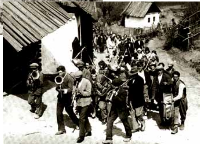
Roma-Siedlung Stegersbach, 1933.

(klischeehafte, arrangierte Polizeifotos)