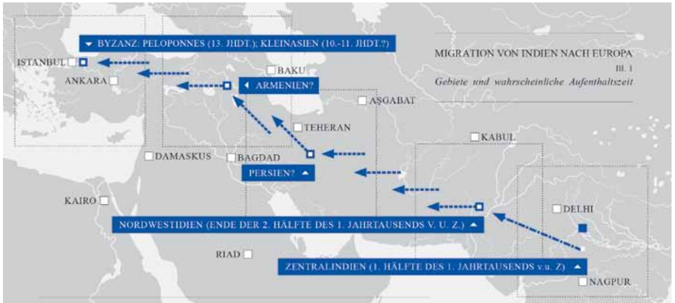
Wanderung von Indien nach Europa. Gebiete und wahrscheinliche Aufenthaltszeit. Aus: Von Indien nach Europa. Fact Sheet 1 des Europarats zur Geschichte der Roma (Grafik: Marcus Wiesner). Online unter: www.coe.int/t/dg4/education/roma/Source/FS2/1.0_india-europe_german.pdf