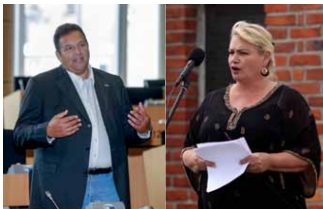
rechts: Soraya Post. links: Romeo Franz.

Viele Roma engagieren sich nicht nur auf nationaler Ebene, sondern sind auch international politisch aktiv. Soraya Post etwa, Romni aus Schweden, war von 2014 bis 2019 Mitglied des Europäischen Parlaments. Ihre Arbeit für die Befassung mit Antiziganismus und die Anerkennung der Rechte der Roma war von großer Bedeutung. Der Politiker und Künstler Romeo Franz war von 2018 bis 2024 der erste deutsche Sinto im Europäischen Parlament und setzte sich dort u.a. für den Erhalt und die Förderung der Kultur der Roma/Romnja und Sinti/Sintizze ein.