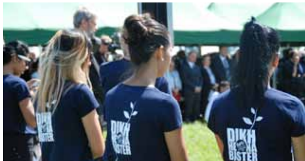
ternYpe – Gedenkfeier der Roma-Jugend am 2. August in Auschwitz-Birkenau.

ternYpe Die europäische Roma-StudentInneninitiative organisiert rund um den 2. August jährlich eine Sommerakademie für StudentInnen und SchülerInnen aus der ganzen Welt.