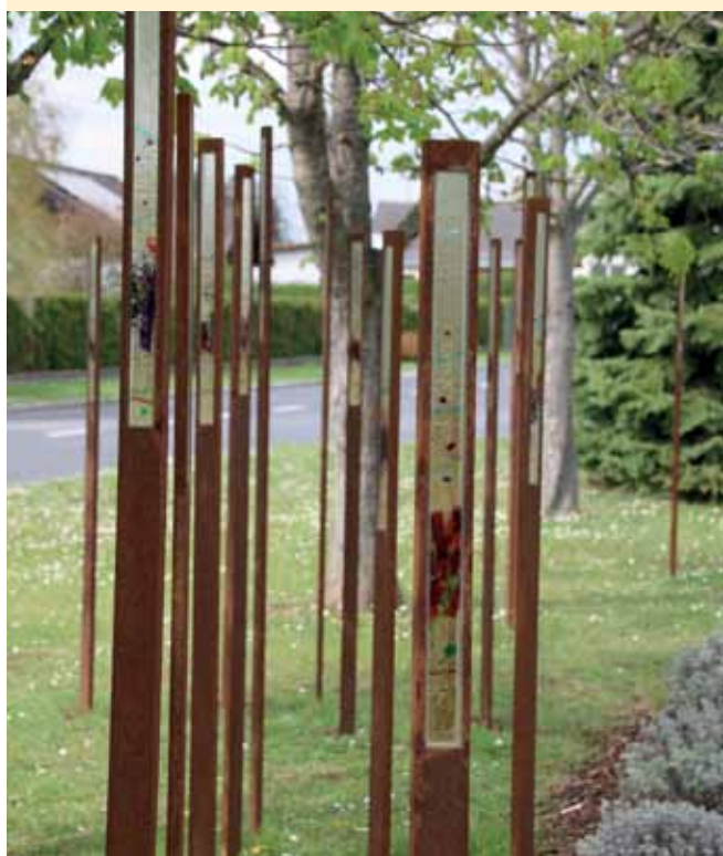
Gedenkstätte in Langental.