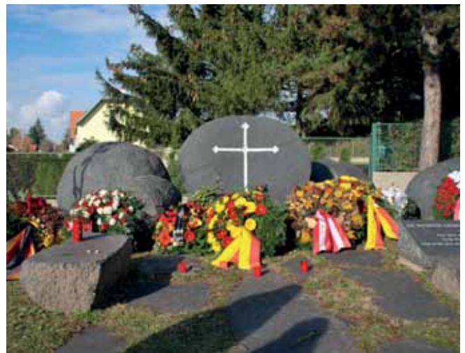
Das Mahnmal in Lackenbach.

Zentraler Gedenkort der österreichischen Roma ist die Gedenkstätte beim ehemaligen „Zigeuner-Anhaltelager“ Lackenbach im Mittelburgenland, von wo aus rund 2.000 Roma und Sinti nach Łódź und dann weiter ins Vernichtungslager Chelmno/Kulmhof deportiert wurden. Auf Anregung der österreichischen Opferverbände wurde am 6. Oktober 1984 in Lackenbach ein Mahnmal für die dort internierten Roma und Sinti von Bundespräsident Rudolf Kirchschläger enthüllt. Seit 1990 wird hier jährlich im November der Opfer gedacht. Bundespräsidenten, ParlamentspräsidentInnen, Bundeskanzler und die Landeshauptleute des Burgenlands halten Gedenkreden in Anwesenheit von Überlebenden des NS-Terrors unter den Roma und Sinti und deren Nachkommen sowie des diplomatischen Korps. Die Gedenkfeier wird gemeinsam vom Land Burgenland und dem Kulturverein österreichischer Roma organisiert.