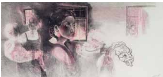
Aus der Serie „Das Romadorf“ von Robert Gabris: www.robertgabris.com/romadorf.html