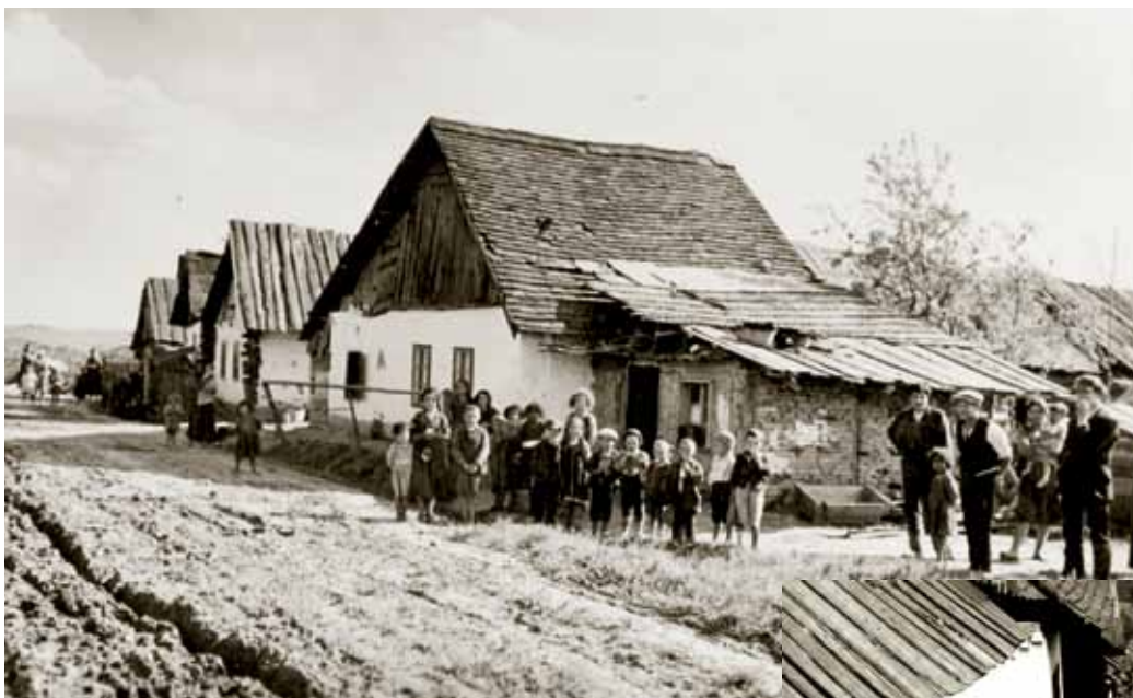
Roma-Siedlung Unterschützen, 1930er-Jahre.