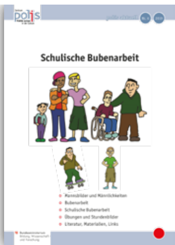
SCHULISCHE BUBENARBEIT polis aktuell 9/2019