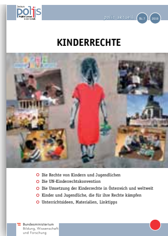
KINDERRECHTE polis aktuell 7/2019