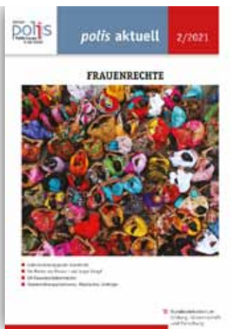
FRAUENRECHTE polis aktuell 2/2021