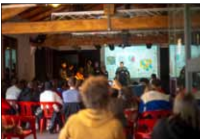
Jugendliche bei der 1. MyResistance Jugendkonferenz in Bologna

www.suedwind.at/myresistancedigitaltoolkit