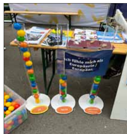
polis Infostand beim Europatagsfest