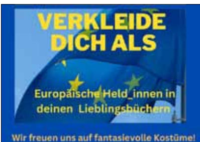
Faschingsaktion des Akademischen Gymnasiums Wien am 21. Februar 2023

Zentrum polis und das Verbindungsbüro des EP statteten 17 Schulen in ganz Österreich Evaluierungsbesuche ab und bekamen so einen umfassenden Einblick, wie das Botschafterschulenprogramm umgesetzt wurde. Alle Schulen waren erfolgreich und erhielten am 15. Dezember 2023 im Rahmen einer Verleihungsfeier im Haus der EU den Status „ Botschafterschule des Europäischen Parlaments “.