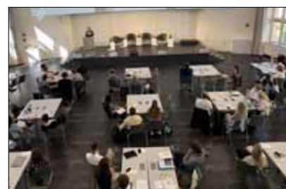
IGPB Jahrestagung in der Arbeiterkammer Wien.