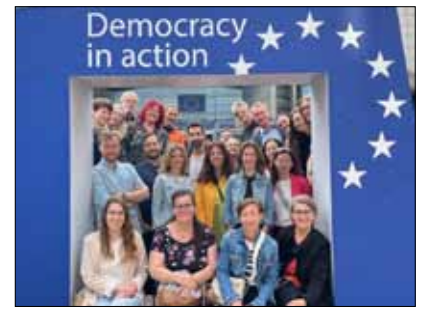
Reisegruppe, Juni 2023