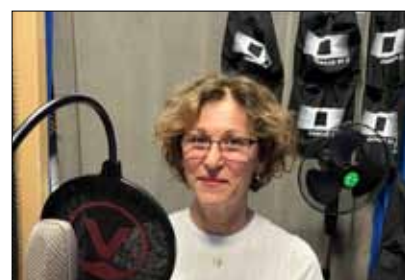
Impressionen von der Podcast-Produktion.