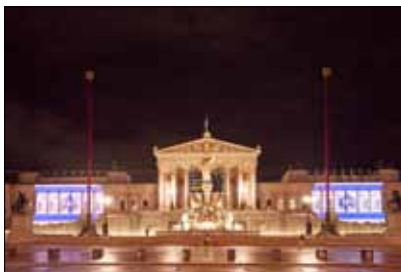
Als Zeichen der Solidarität wurde am 9. Oktober 2023 das Parlament in den Nationalfarben Israels bestrahlt.