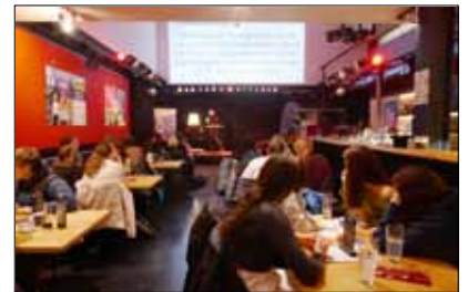
EU-Pubquiz am Spielboden in Dornbirn