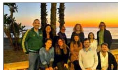
Partnermeeting in Málaga im November 2023