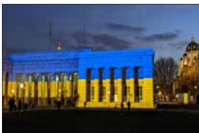
Aus Solidarität mit der Ukraine wurde das Burgtor in den vergangenen zwei Jahren jeweils zum Unabhängigkeitstag in den Nationalfarben der Ukraine beleuchtet.