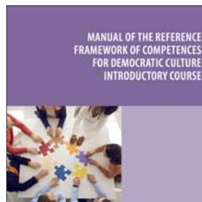
Coverausschnitt des Kurshandbuchs