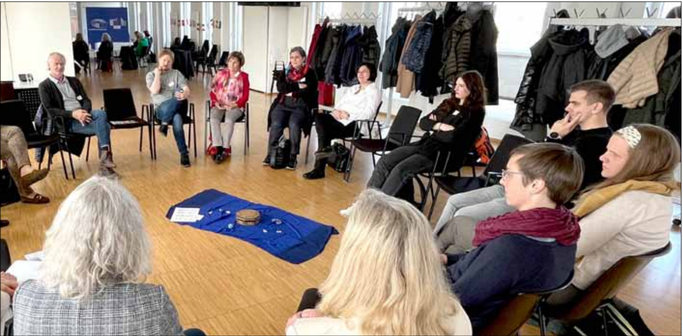
Jahrestagung des Netzwerks EUropa in der Schule am 17. März 2023