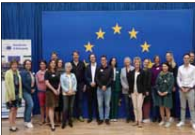
Einführungsseminar am 29. September 2023 im Haus der EU.

Das Schuljahr 2023/24 startete wie im letzten Jahr mit 20 angehenden Botschafterschulen . Am 29. September 2023 fand das Einführungsseminar im Haus der EU statt, das von Zentrum polis gemeinsam mit dem Verbindungsbüro des EP organisiert und durchgeführt wurde. Der Europaabgeordnete Thomas Waitz (Grüne) nahm sich viel Zeit, um die Fragen der Teilnehmenden zu beantworten. Die angesprochenen Themen erstreckten sich vom European Green Deal über EU-Erweiterung, Freihandelsabkommen bis hin zur EU-Taxonomie und Neutralität. Außerdem erfuhren die Teilnehmenden mehr über das Programm, erhielten Tipps für die Öffentlichkeitsarbeit und hatten zum Abschluss die Gelegenheit, die im Mai 2023 eröffnete, multimediale, interaktive Dauerausstellung „Erlebnis Europa“ in Wien kennenzulernen.