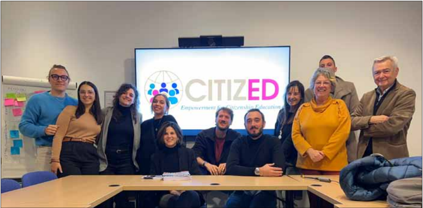
Das CITIZED-Team bei der Abschlusskonferenz des Projekts im November 2023 in Brüssel.