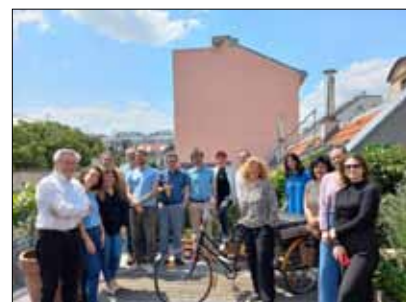
Partnermeeting in Wien im Juni 2023