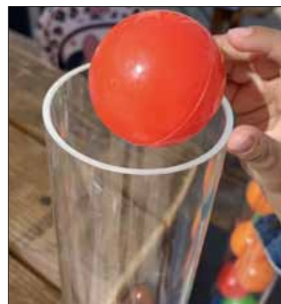
Bei Summer in the City mit dabei: Wahlsäulen

Die Arbeiterkammer Wien bot bei ihrem Gratis-Sommer-Programm von 3. bis 28. Juli 2023 ein buntes Programm von Grätzlevents, Spaziergängen, Workshops und vielem mehr. Zentrum polis war am 6. und 27. Juli mit drei Demokratiewerkshops dabei: Im Workshop „Recht(e) hat jedeR“ wurden Kinder mit ihren Rechten vertraut gemacht. Die Auseinandersetzung mit dem Recht auf Partizipation soll einen Beitrag zur Stärkung ihres Selbstbewusstsein leisten. Im Workshop „Wählen – Bringt das wirklich was?“ erfuhren die TeilnehmerInnen mithilfe von Wahlsäulen aus erster Hand, was es heißt, wählen zu dürfen oder von einer Wahl ausgeschlossen zu sein. Im Gruppenexperiment „Gewinnt, so viel ihr könnt!“ tauchten die TeilnehmerInnen in die Arbeitswelt ein und wurden immer wieder vor die Wahl gestellt: Konkurrenz oder Kooperation? Was die TeilnehmerInnen als spielerische Selbsterfahrung lernen konnten: Kooperation ist erfolgreich!