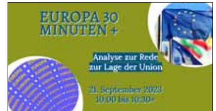
Ankündigung zu Europa 30 Minuten+ Analyse der Rede zur Lage der Union