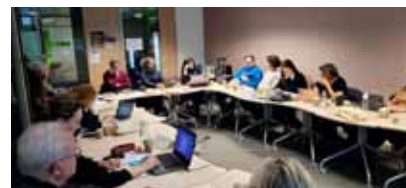
Partnermeeting in Nizza im Jänner 2023