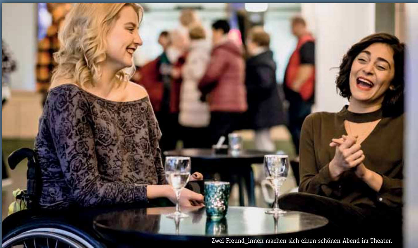
Zwei Freund_innen machen sich einen schönen Abend im Theater.