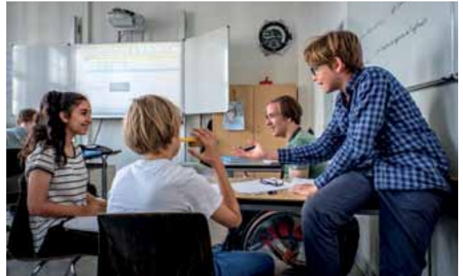
Ein Schüler im Rollstuhl an der inklusiven Sophie-Scholl Schule in Berlin.

Die Konvention schließt alle Lebensbereiche ein, darunter auch das Bildungswesen. Artikel 24 der UN-BRK umfasst das Recht auf Bildung ohne Diskriminierung auf der Grundlage der Chancengleichheit. Österreich ist verpflichtet, ein inklusives Bildungssystem auf allen