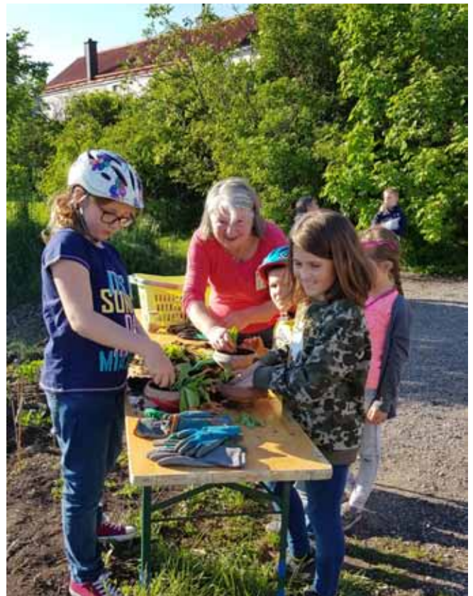
Schnittlauchfest im inklusiven Begegnungsgarten.

vationen der Anfangszeit sind zu selbstverständlicher Praxis geworden. An den Nahtstellen entstand eine Kultur des Austauschs und der Zusammenarbeit – sowohl unter den Pädagog_innen als auch bei Eltern und Kindern. Dazu gehören einrichtungsübergreifende Arbeitsgruppen, gegenseitige Einladungen, gemeinsame Unterfangen wie Theater- und Musikprojekte und Fortbildungen als Basis und Garant für qualitativvolle Weiterentwicklung des Projekts. Das im damaligen Demokratisierungsschub entstandene Kinderparlament bespricht alle für die Schulgemeinschaft wichtigen Themen und stößt damit immer wieder wichtige Innovationsschritte an. Auch in die Themenfindung für die Leitbildentwicklung der Gemeinde war es eingebunden. Die Musikschule kultiviert mit den Bläser- und Streicherklassen in der Volksschule ihren inklusiven Ansatz. Eine der zweiten Klassen kann sich entscheiden, im dritten und vierten