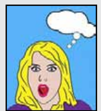
Pixabay (Lizenz: CCO Public Domain)

Die kunstphilosophische Strömung Pop Art entstand in den 50er Jahren des letzten Jahrhunderts als Gegenbewegung zu einer als elitär verstandenen Hochkultur (ausgehend von England und den USA). Sie betonte den kulturellen Wert des Profanen, Alltäglichen. Die Grenzen von Kunst und Leben sollten sich in „poppigen“ Erscheinungsformen auflösen, in knallbunten Darstellungen von Alltagsgegenständen (wie Suspendosen oder Cola-Flaschen) in Mode, Film, Comics oder Werbung.