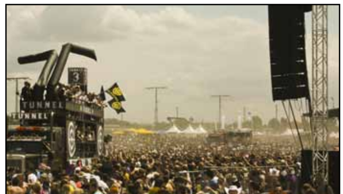
19. Love Parade in Duisburg, Deutschland, 2010.

Vor allem in den 90er Jahren fanden dröhnende Bässe, wummernder Techno-Sound und Party-Events ein breites Publikum. Die politischen Botschaften dieses Sounds, der ohne Texte auskommt, reichen von „ Transform the Norm – Do it yourself “ (einer Freeparade gegen Neoliberalismus) bis hin zu „Friede, Freude, Eierkuchen“, der ersten Love