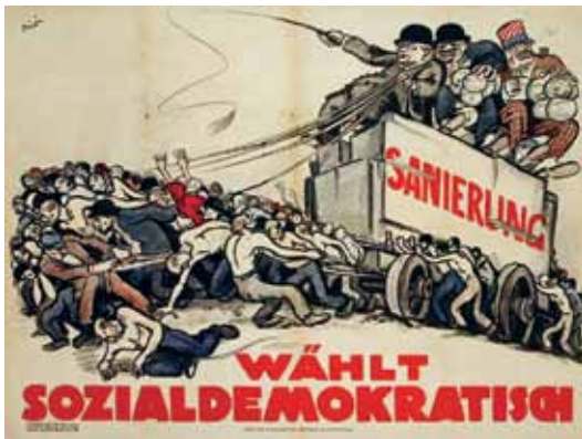
Biró, Mihály: Sanierung – wählt sozialdemokratisch, 1923.

Beurteilen Sie die politische Kultur der Ersten Republik und den Einfluss der Wirtschaftslage.