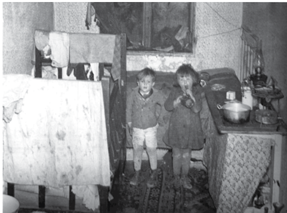
links: Elendsquartier in Wien um 1930. © ÖNB #351442

Die Habsburgermonarchie mit 53 Millionen EinwohnerInnen wurde mit dem Vertrag von St. Germain (1919) zur Republik Österreich mit 6,5 Millionen EinwohnerInnen, der „Anschluss“ an Deutschland wurde verboten. Einstige Binnengrenzen wurden zu Außengrenzen. Viele zweifelten an der Lebensfähigkeit dieses Kleinstaats. Einem hohen Industrialisierungsgrad und einem hochentwickelten Bankwesen standen ein überdimensionierter Beamtenapparat („Wasserkopf“ Wien) und vielfach nicht mehr passend dimensionierte Wirtschaftsstrukturen gegenüber. Die Restrukturierung der Wirtschaft in den Nachkriegsjahren war ein schmerzhafter Prozess; die Lebensmittelversorgung war schlecht, Arbeitslosigkeit und Inflation waren hoch.