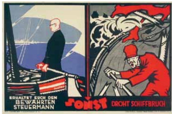
Reisser, August: Erhaltet Euch den bewährten Steuermann sonst droht Schiffbruch, 1923.