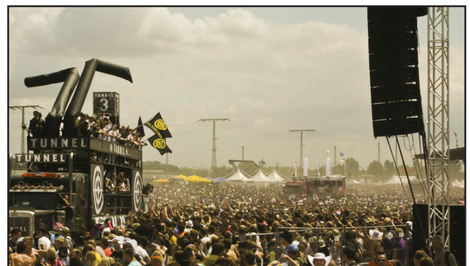
19. Love Parade in Duisburg, Deutschland, 2010.

Vor allem in den 90er Jahren fanden dröhnende Bässe, wummernder Techno-Sound und Party-Events ein breites Publikum. Die politischen Botschaften dieses Sounds, der ohne Texte auskommt, reichen von „ Transform the Norm – Do it yourself “ (einer Freeparade gegen Neoliberalismus) bis hin zu „Friede, Freude, Eierkuchen“, der ersten Love