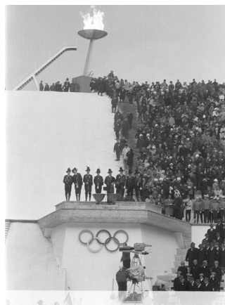
links : Nationalfeiertag, Tag der Fahne in Wien. Blick vom Ring in die Kärntner Straße.