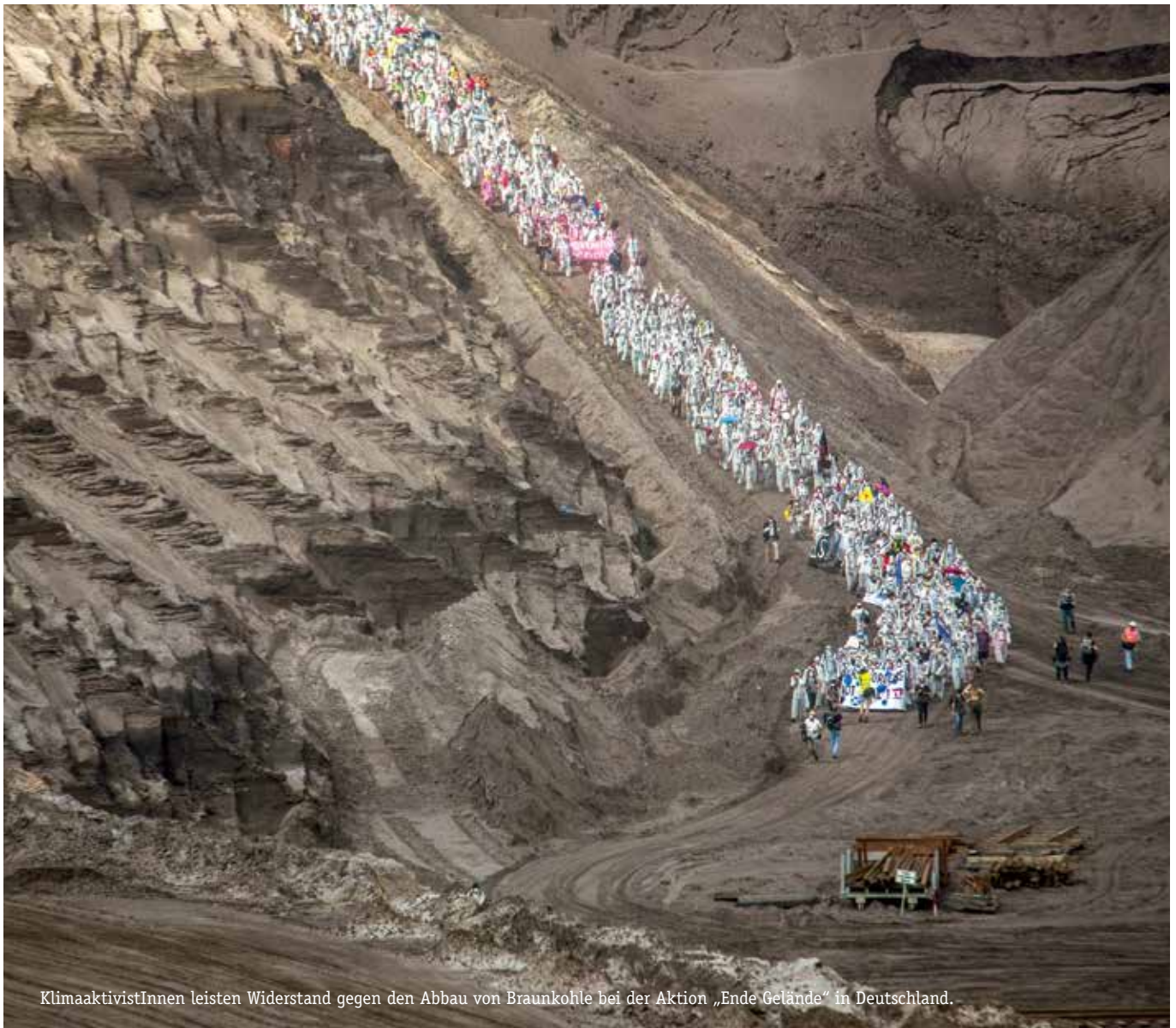
KlimaaktivistInnen leisten Widerstand gegen den Abbau von Braunkohle bei der Aktion „Ende Gelände“ in Deutschland.