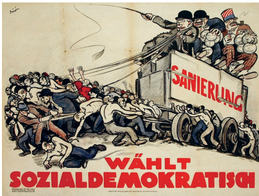
Biró, Mihály: Sanierung – wählt sozialdemokratisch, 1923.

Beurteilen Sie die politische Kultur der Ersten Republik und den Einfluss der Wirtschaftslage.