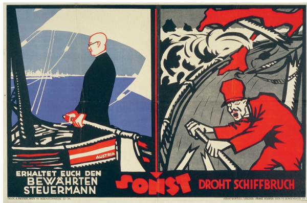
Reisser, August: Erhaltet Euch den bewährten Steuermann sonst droht Schiffbruch, 1923.